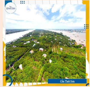
Cồn Thới Sơn

09h30: Tàu Ghé Cồn Lân (Cù Lao Thới Sơn) , quý khách tản bộ trên con đường làng, tham quan nhà dân, và vườn cây ăn trái, thưởng thức các loại trái cây theo mùa và nghe đàn ca tài tử Nam Bộ. Đến tham quan trại nuôi ong mật, thưởng thức trà mật ong chanh.