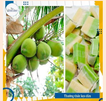
Thưởng thức kẹo dừa

10h00: Quý khách dùng xuồng chèo len lỏi vào rạch nhỏ ngắm nhìn 2 hàng dừa nước thiên nhiên và phong cảnh đơn sơ của miệt vườn. Quý khách sẽ trải nghiệm cảm giác đi xuồng chèo trong con rạch nhỏ dưới hai hàng dừa nước xanh mát . Đến nhà dân, đoàn dùng chân thưởng thức tách trà mật ong, đoàn tiếp tục đi bộ trên đường làng. Đoàn tham quan lò kẹo dừa – đặc sản Bến Tre , tham quan lò bánh tráng.