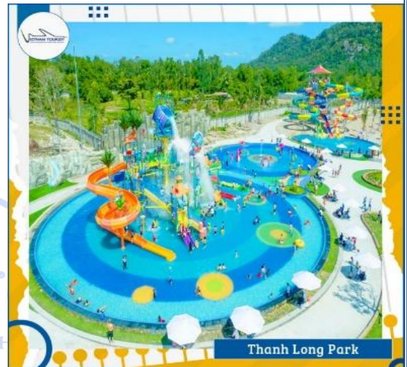
Thanh Long Park

Hoặc Quý khách có thể trải nghiệm công viên nước THANH LONG PARK đầu tiên và lớn nhất ở An Giang ""siêu to siêu đã"" tọa lạc ngay Lâm viên Núi Cấm. Quảng tung bừng với nhiều hoạt động giải trí thư giãn bên bể tạo sóng, máng trượt, vòng xoắn ốc, suối thác nhân tạo, khu vui chơi Amazon Kids. Tha hồ check-in tự sướng, sống ảo với những góc đẹp không bao giờ chết tại Hồ Vô Cực. (Chi vé tự túc).