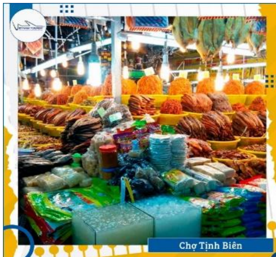
Chợ Tịnh Biên

09h00: Quý khách đi mua sắm tại Chợ Tịnh Biên là khu chợ biên giới tiếp giáp giữa Việt Nam và Campuchia , nổi tiếng là trung tâm mua sắm sầm uất với các mặt hàng đa dạng trong và ngoài nước, hàng hóa khá rẻ và nhiều mặt hàng độc đáo chất lượng mà mà không phải ở đâu cũng có. Toàn khu chợ bao gồm các sạp bán liền kề nhau bày bán đa dạng các mặt hàng nội địa và ngoại nhập với mức giá tương đối rẻ như khăn, chăn mền, áo quần, mỹ phẩm,... Các loại đồng hồ cao cấp ngoại nhập, đa dạng kiểu dáng cũng được bày bán rất nhiều. Nổi bật ở khu thực phẩm là các loại khô mắm thơm ngon, đẹp mắt được rất nhiều các du khách mê mẩn như mắm cá linh, khô cá tra phòng, khô cá sủu, mắm thái, mắm sặc, mắm trê, mắm lóc,... tất cả đều có hương vị đặc trưng hấp dẫn với giá chỉ vài chục ngàn đồng.