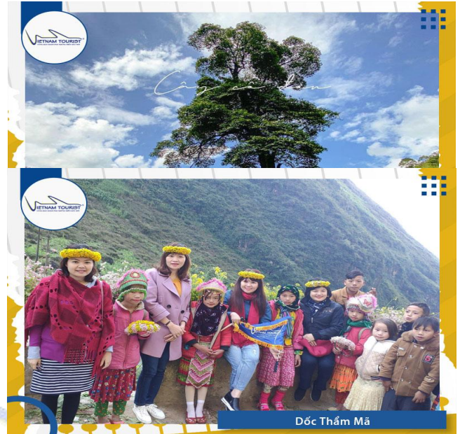
Đốc Thẩm Mã

09h30: Quý khách tiếp tục hành trình, trên đường đi xe ghé Đốc Thẩm Mã với những đường cong ẩn tượng trên đoạn đường từ thị trấn Yên Minh lên xã Phó Cáo (huyện Đồng Văn). Tại đây quý khách có thể chụp hình cùng với các bé gái H'mông xinh xắn và dễ thương.