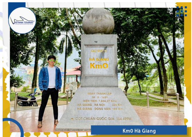
Km0 Hà Giang

06h30: Quý khách làm thủ tục trả phòng khách sạn, dùng điểm tâm