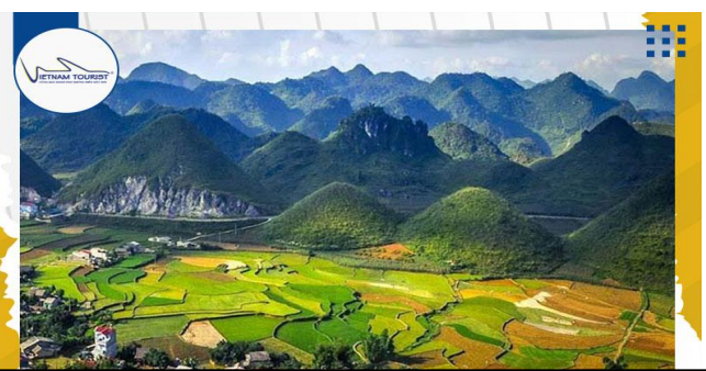
Núi đôi Cô Tiên