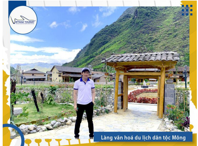
Làng văn hoá du lịch dân tộc Mông

09h30: Quý khách ghé thăm quan Làng văn hoá du lịch cộng đồng dân tộc Mông được ví như bông hoa rực rỡ giữa dưới chân đèo Mã Pì Lèng hùng vĩ, nằm nép mình bên dòng sông Nho Quế xanh ngắt, uốn lượn, thơ mộng nơi vùng đất địa đầu tổ quốc. Đến với làng văn hóa du lịch cộng đồng dân tộc Mông , thôn Pả Vi Hạ là đến với một không gian mang đậm bản sắc văn hóa của người Mông nơi đây với những nếp nhà trình tường truyền thống với hàng rào đá, vách đất nâu, những bắp ngô phơi trên xà nhà, với những người dân thật thà chân chất trong những bộ váy áo thổ cẩm đẹp đặc sắc và những món ăn mang đậm nét truyền thống không nơi nào có được.