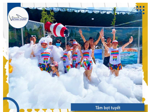
Tắm bọt tuyết

Đặc biệt quý khách sẽ được tham gia chương trình có