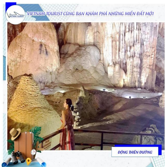
VIETNAM TOURIST CÙNG BẠN KHÁM PHÁ NHỮNG MIỀN ĐẤT MỚI ĐỘNG THIÊN ĐƯỜNG