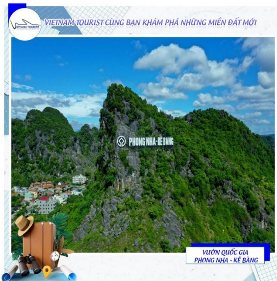
VIETNAM TOURIST CÙNG BẠN KHÁM PHÁ NHỮNG MIỀN ĐẤT MỚI VƯỜN QUỐC GIA PHONG NHA - KẼ BÀNG

12h00: Quý đoàn dùng bữa trưa với những món ăn đặc sản địa phương