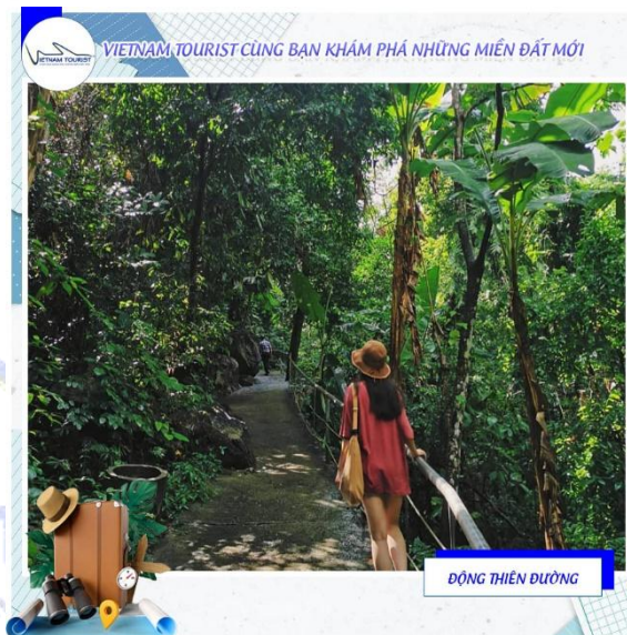
VIETNAM TOURIST CÙNG BẠN KHÁM PHÁ NHỮNG MIỀN ĐẤT MỚI ĐỘNG THIÊN ĐƯỜNG