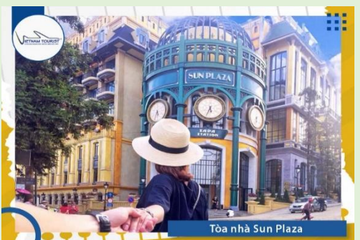
Tòa nhà Sun Plaza