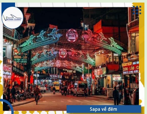
Sapa về đêm