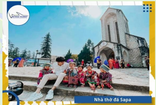
Nhà thờ đá Sapa