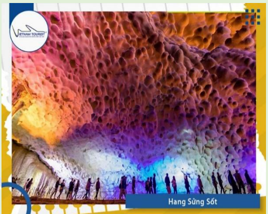
Hang Sừng Sốt