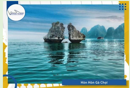
Hòn Hòn Gà Chọi